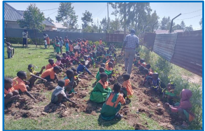
unsere GBA-Kinder beim Pflanzen von Bäumen an der Schule