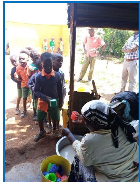
Die Kinder stellen sich für die Porridge-Ausgabe an.