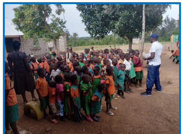
Pause an der GBA