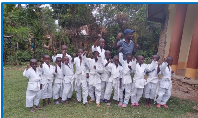
das Judo-Team an der GBA