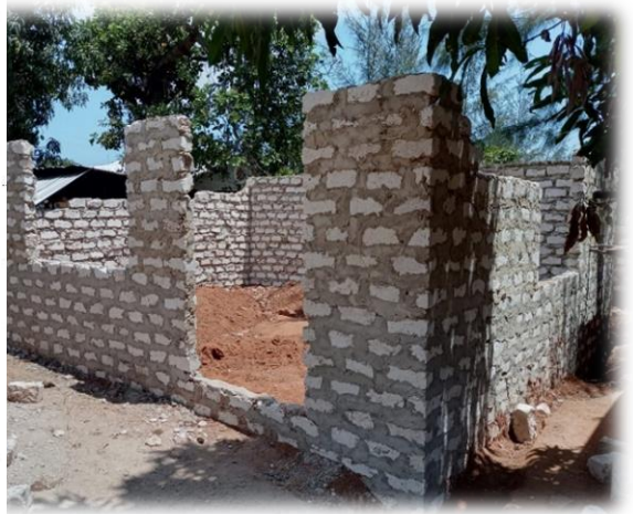
der Bau unserer neuen Schulküche schreitet voran

Die Kinder an unserer GGA haben ihre schulischen Interessenvertreter sowie Verantwortlichen für bestimmte entscheidende Positionen im Schulalltag gewählt. Die Ergebnisse sind oben zu sehen (gern heranzoomen).