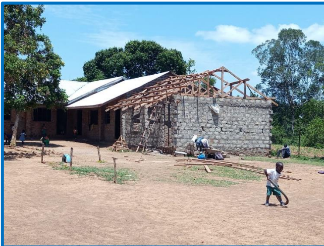
Der Dachausbau des neuen Klassenzimmers an der GBA schreitet voran.