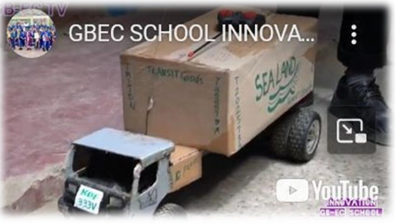
GBEC SCHOOL INNOVA...