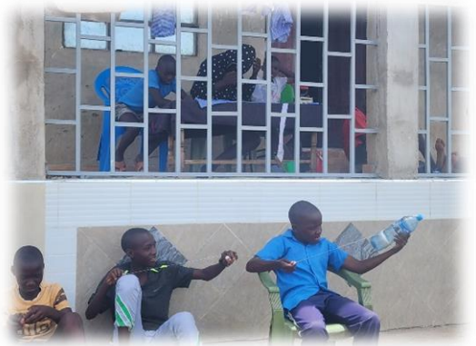
beim Basteln vor dem Haus