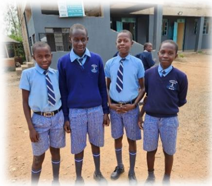
vor der Schule