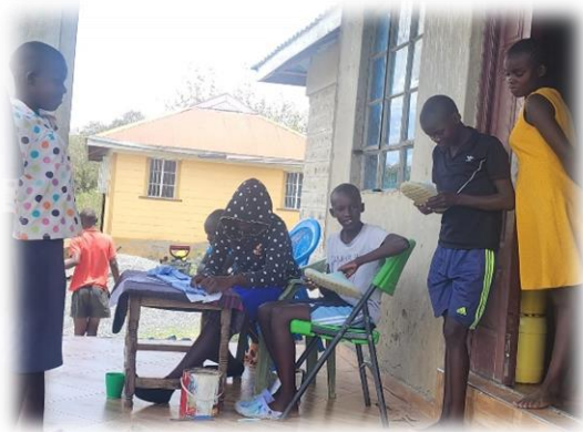
unsere Jugendlichen in Rongo vor dem Haus