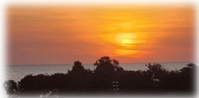
Sonnenuntergang in Orore

In Orore planen wir aktuell ein größeres Fencing-Projekt , das unser Light-Home-Gelände weitläufig und professionell mit einer steinernen Mauer umgrenzen soll, um die Sicherheit für unsere Kinder zu gewährleisten und außerdem den Grundstein dafür zu legen, dass wir nächstes Jahr unsere landwirtschaftlichen Projekte ausbauen und die Ernte sichern können. Die ersten Betonpfeiler wurden geliefert.