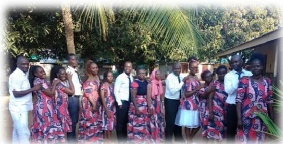
das Lehrerkollegium an der GGA