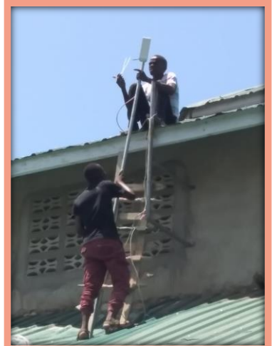
Die GGA wird mit Empfangs- verstärkern für das neue WLAN ausgestattet.