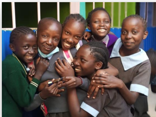
Kinder des GB-EC und SHS vereint