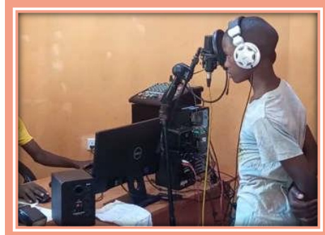
der Media Club zur Talente- Entwicklung