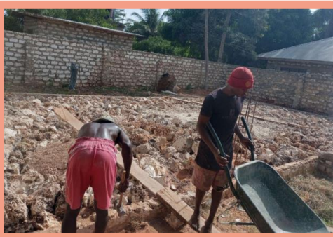
Bau neuer Klassenräume