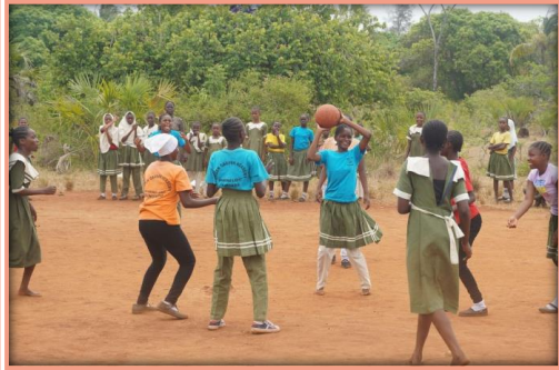
Games Day an der GGA