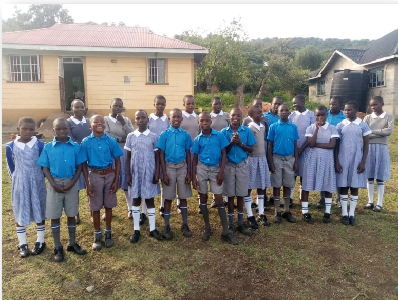
ein aktuelles Foto unserer Jungs und Mädels aus Orore