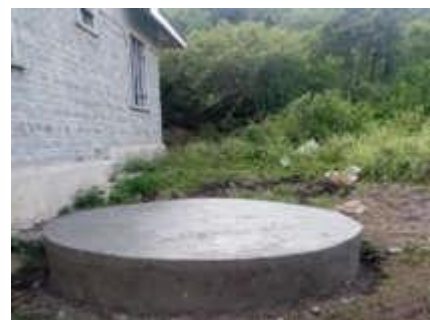
Unsere Maurertruppe legte die Basis für einen neuen Wassertank zum Filtern von Regenwasser.