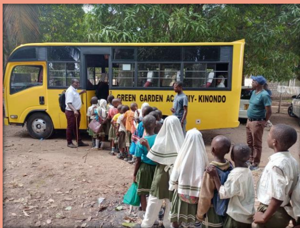
unser neuer GGA-Schulbus