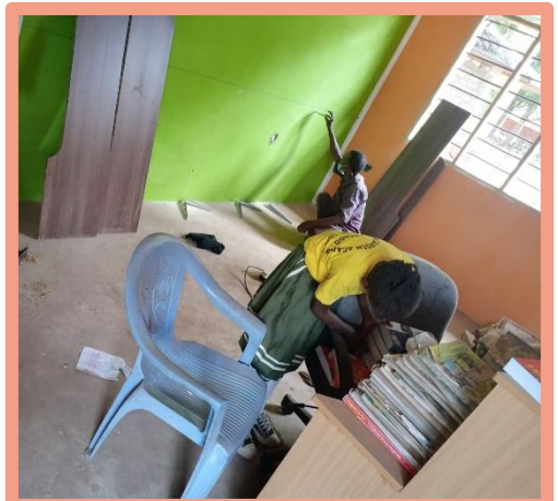
die Schulbibliothek entsteht