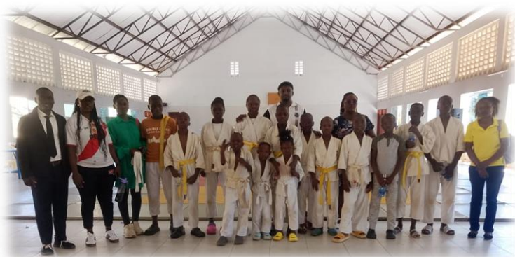
das Judo -Team der GBA beim Turnier an der GGA