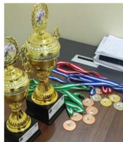
Medaillen beim 2. National League Judo Event in Rongai: 2x Gold, 3x Silber, 6x Bronze