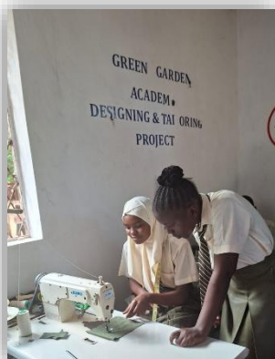
Im Tailoring- Projekt fertigen wir unsere Schuluniformen schon seit geraumer Zeit selbst.