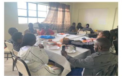
Vertreter des Bildungsministeriums zu Besuch in unserer HoG