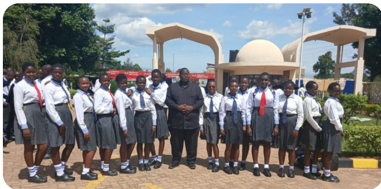
Schulusflug an die Kibabii Unviersity in Bungoma