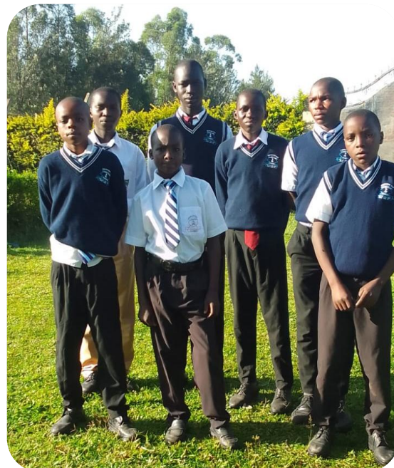
unsere Jungs in Rongo