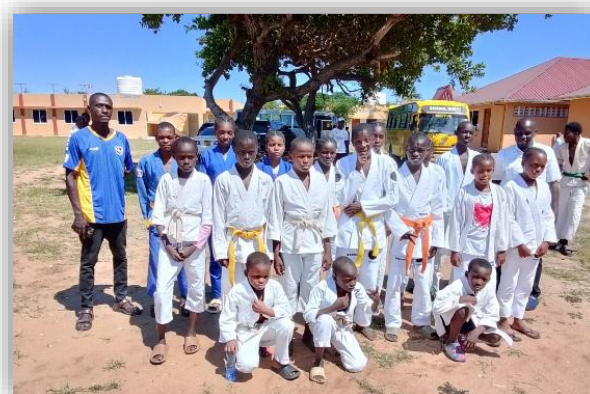
Das Judo -Team unserer GGA beim großen überregionalen Turnier, wo neben Mannschaften unserer Projekte GGA und HoG auch Teams aus Kiambu und Malindi teilgenommen haben.