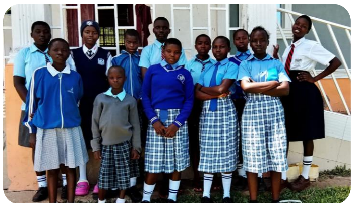
unsere Mädels in Orore