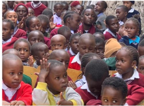
Regen Andrang gibt es bei den Motivationstreffen , bei denen Kinder das Lernen lernen und Verbesserungsvorschläge offen besprochen werden.