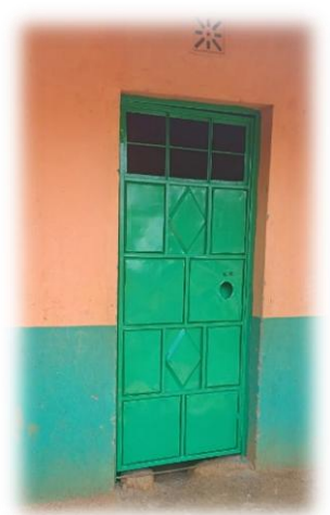
eine neue Klassenzimmer- tür für unsere GBA