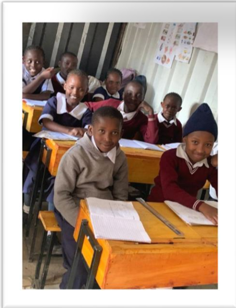
Primary School Class